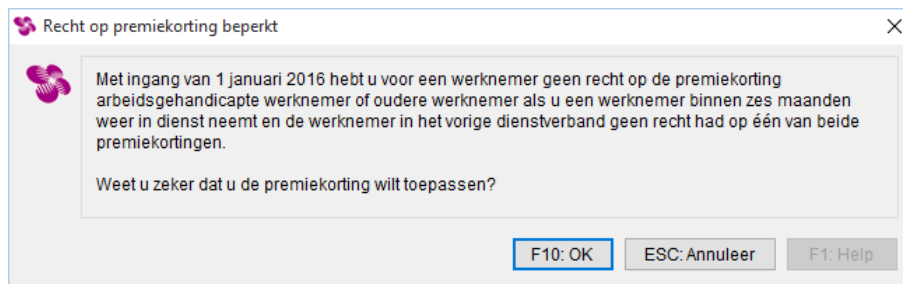
Afbeelding: Recht op premiekorting beperkt

Loon geeft hierover ook een waarschuwing als de subsidie wordt aangevinkt: