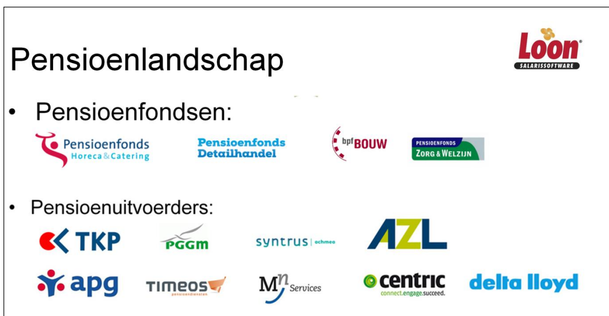
Afbeelding: Pensioenfondsen en -uitvoerders anno 2018

In onderstaande afbeelding ziet u een aantal pensioenfondsen die hun administratie uitbesteden aan pensioenuitvoerders. Deze pensioenuitvoerders komt u ook tegen in Loon omdat u periodiek de aangifte aanlevert aan een van deze uitvoerders. De concurrentie is anno 2017 en 2018 groot en pensioenfondsen zijn dan ook met name de laatste jaren op zoek naar een uitvoerder die hun het beste past. Vandaar dat we de afgelopen jaren al wat verschuivingen hebben gezien.