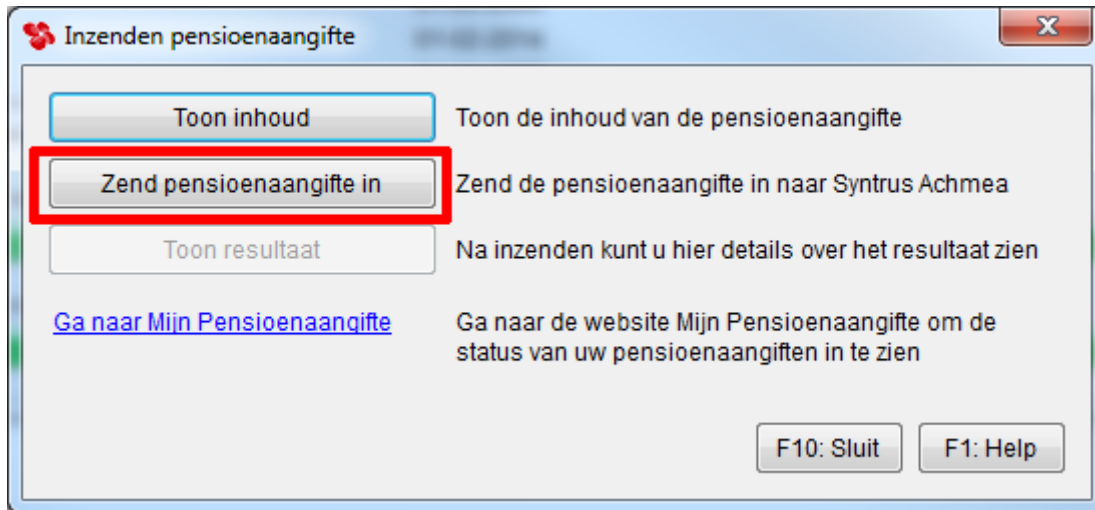
Afbeelding: 'Overzichten, 'Periodieke opgaven, 'Pensioenaangifte', 'Zend in'

Als u de data gecheckt hebt, en in orde bevonden dan geeft u 'F10:OK'. U kunt nu de pensioenaangifte echt gaan insturen met de knop 'Zend pensioenaangifte in':