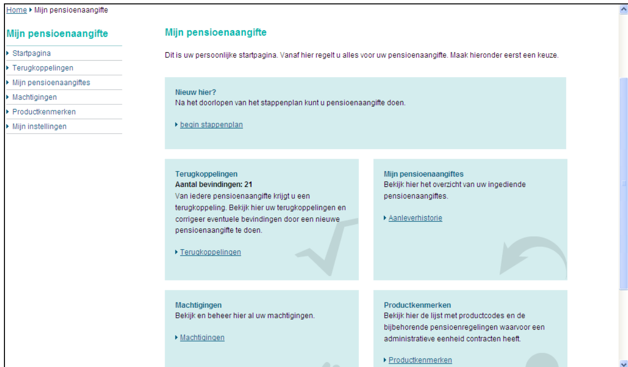
Afbeelding: Mijn Pensioenaangifte

Na uw pensioenaangiften, kunt u op de site https://www.pensioenaangifte.nl/ diverse data oproepen via 'Mijn pensioenaangifte':