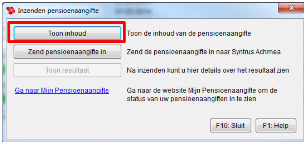
Afbeelding: 'Overzichten', 'Periodieke opgaven', 'Pensioenaangifte', 'Toon inhoud'

Als u op 'Toon inhoud' klikt, ziet u een overzichtje als dit op de eerste pagina: