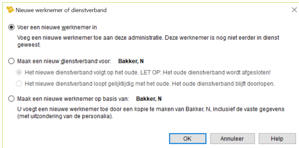
Afbeelding: Nieuwe werknemer of dienstverband

U krijgt nu bij de optie 'Nieuw' vanuit het werknemersscherm vier mogelijkheden te zien. Het scherm ziet er zo uit: