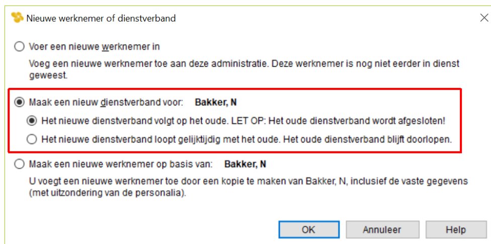
Afbeelding: Nieuwe werknemer of dienstverband, Nieuw dienstverband

Er wordt onderscheid gemaakt tussen een nieuw dienstverband dat het oude dienstverband opvolgt, en een nieuw dienstverband dat gelijktijdig met het oude dienstverband blijft bestaan: