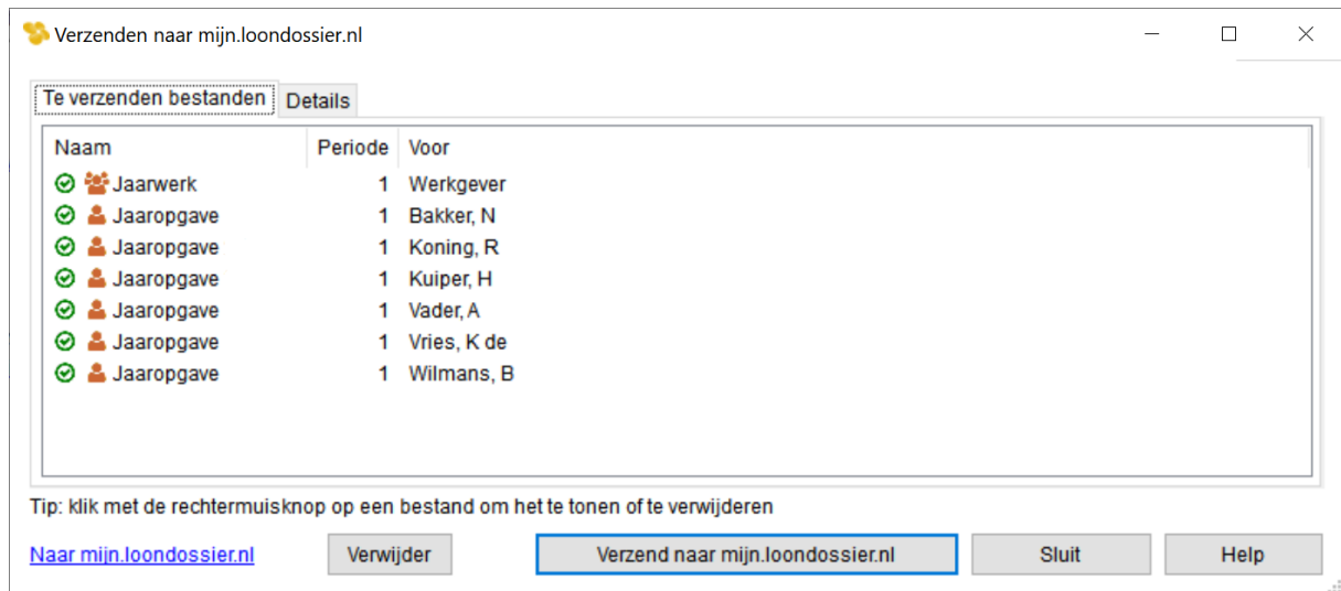
Afbeelding: Werkgever, Verzend gegevens naar mijn loondossier.nl

Volg wederom de gebruikelijke weg: Werkgever, Verzend gegevens naar mijn loondossier.nl. U ziet dan, in ons voorbeeld, dit scherm: