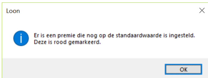
Afbeelding: Wijzig premies, Premies nog op standaardwaarde