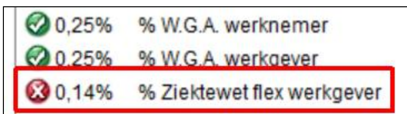
Afbeelding: 'Werkgever', tabblad 2, 'Wijzig premies' (uitsnede)

U belandt na 'OK' in het werkgeversscherm waar u de premies kunt aanpassen. Deze screen dump toont een voorbeeld met één onbekende premie: Ziektewet flex werkgever: