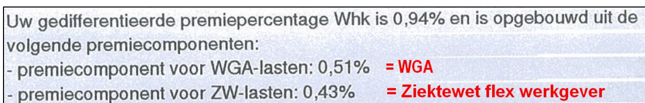
Afbeelding: 'Beschikking fiscus, termen 'vertaald' naar premies in Loon

In schema ziet het er zo uit (voorbeeldpercentages!):