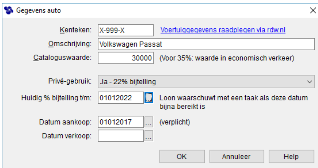
Afbeelding: Werkgevergegevens, Vervoer, Gegevens auto

NB De bijtelling is van toepassing 60 maanden vanaf de datum eerste tenaamstelling.